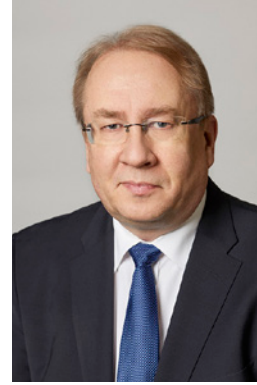
ESA LAGER f. 1959 Finsk medborgare JK, EM

Styrelsemedlem 2017– Medlem av revisionskommittén